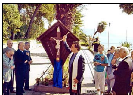
don Guido benedice il Crocifisso

Dopo questa cerimonia, nel Salone dell'Oratorio si è tenuto il Convegno.