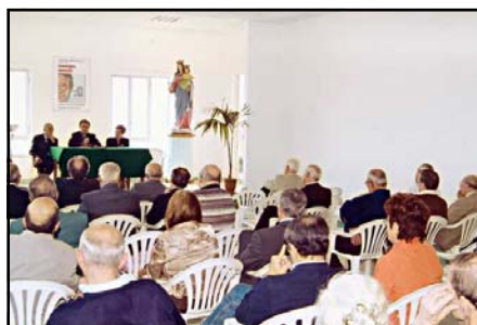
in ascolto attento...

tutti ad essere a fianco dei giovani, di sostenerli ed aiutarli a vincere i loro momenti difficili. Tutto questo sullo sfondo dell'amore cristiano verso il prossimo così ben realizzato da Don Bosco.