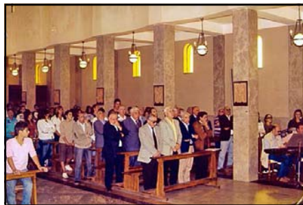
durante la S: Messa

"In questa vita abbiamo le spine... nell'altra le rose" (Don Bosco)