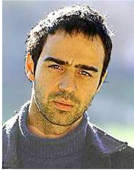
Niccolò Ammaniti, vincitore del Premio letterario "Grinzane France"

È un libro bello, attuale ed appassionante, in cui il grande segreto che Michele custodisce gelosamente, lo porta a crescere, a conoscere se