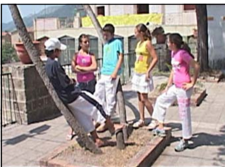
Scena 3: Manuel rifiuta di uscire con gli amici per tener fede all'impegno preso con un animatore.

Ce l'abbiamo fatta!!! Sabato 12 novembre, il nostro cineforum ha riaperto i battenti (per il secondo anno consecutivo) proiettando proprio il primo cortometraggio