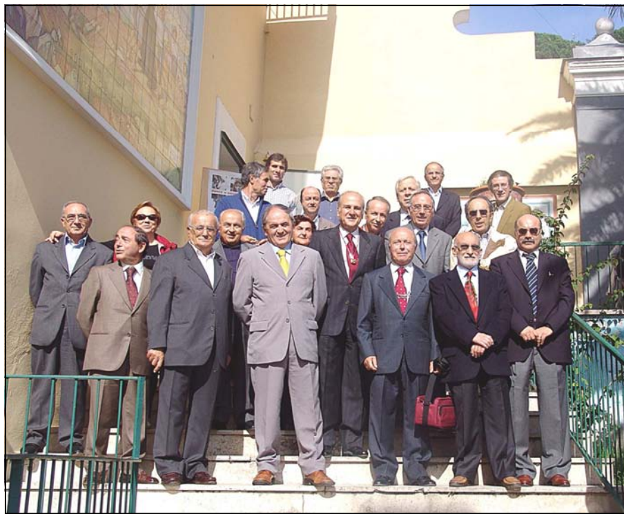
La foto di gruppo 2005

"La prima virtù di un giovane è l'obbedienza al padre e alla madre" (Don Bosco)