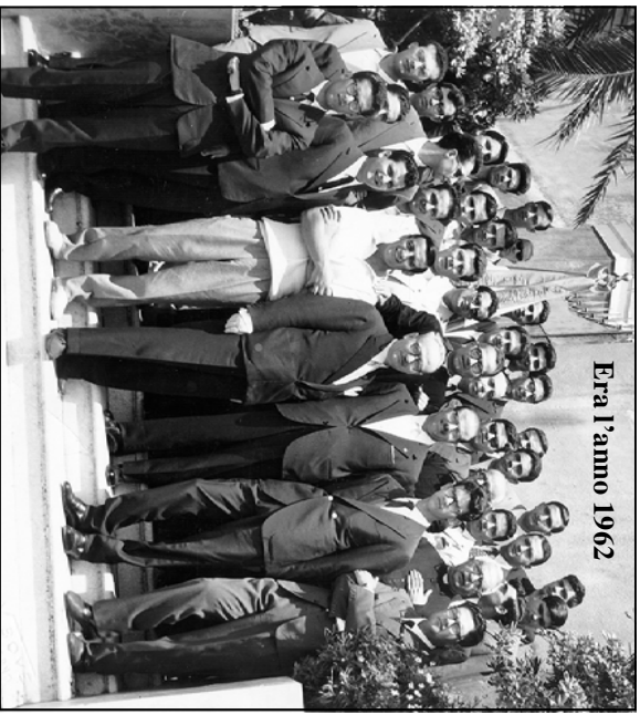
Era l'anno 1962